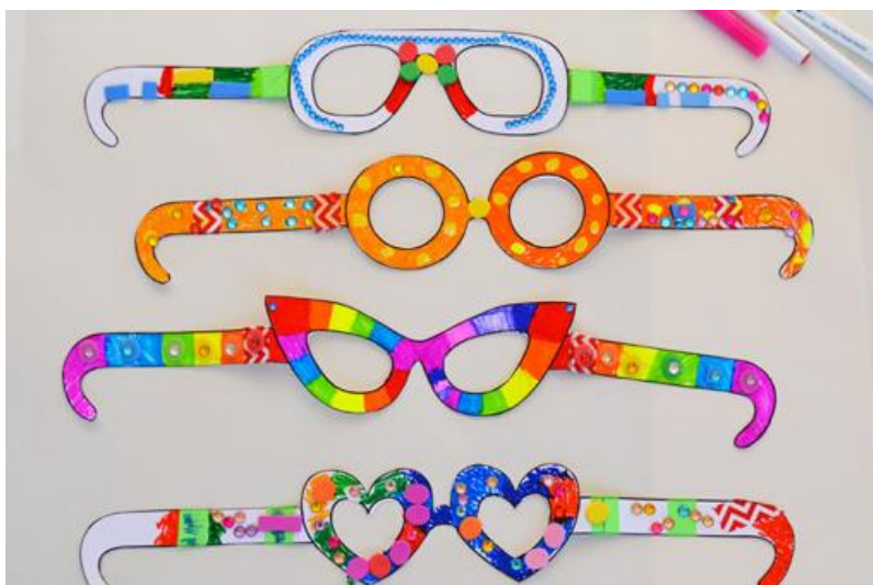
Slika 1. Primjeri kartonskih okvira naočala

Predlošci za naočale: https://picklebums.com/free-printable-crazy-glasses/