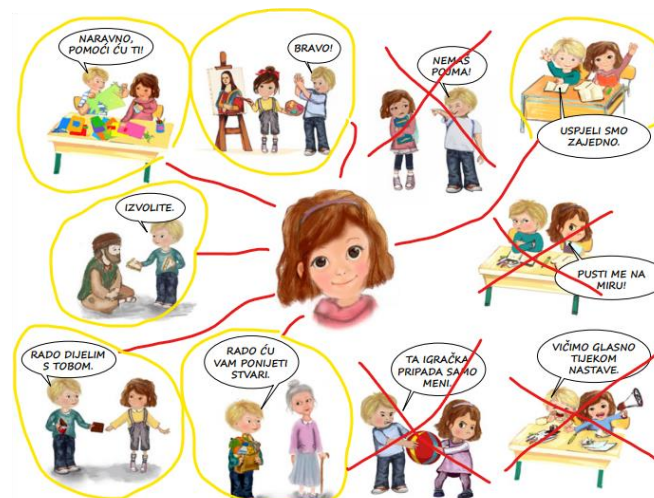
Slika 3. Rješenje 2. zadatka